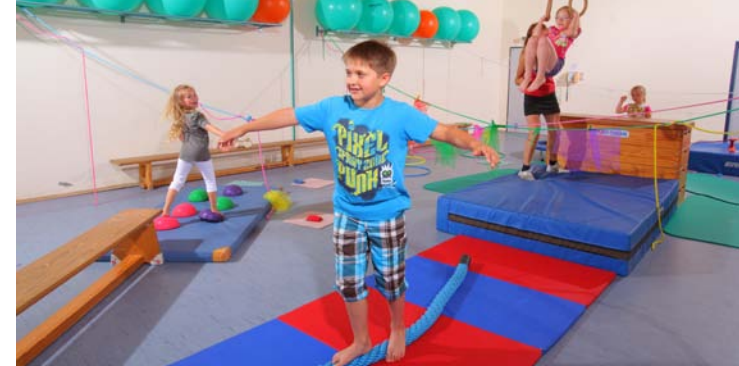
Gruppenaktivitäten im Kindersport