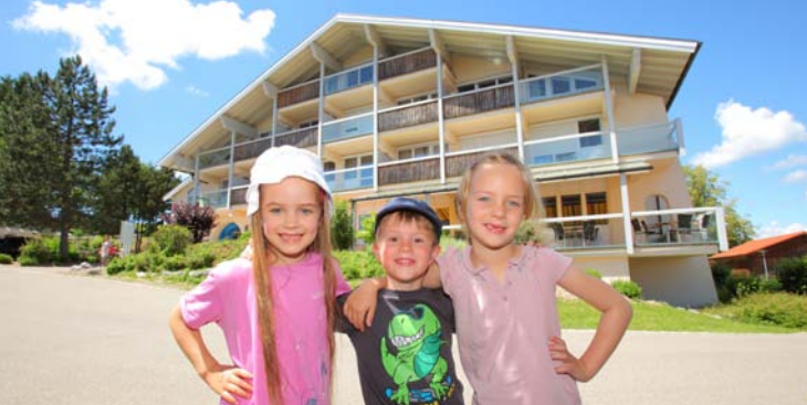
Die Celenus Fachklinik Bromerhof