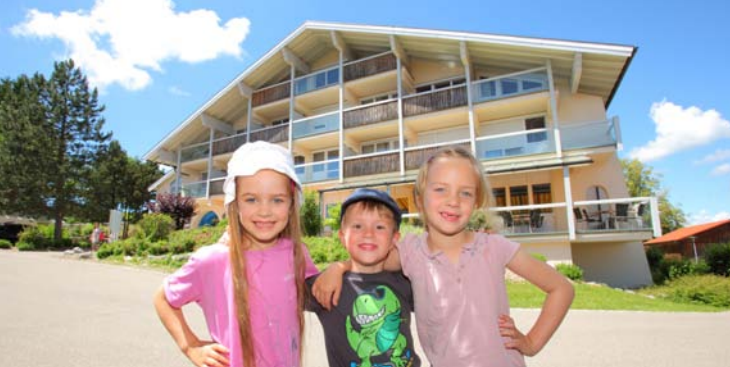
Die Celenus Fachklinik Bromerhof