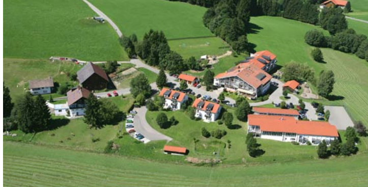
Celenus Klinik Bromerhof