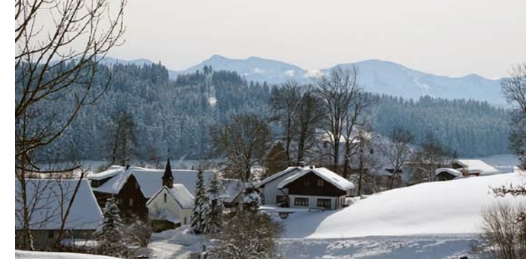
Erholsame Landschaft im Allgäu