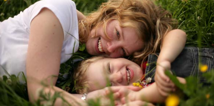
Zusammen die Natur genießen