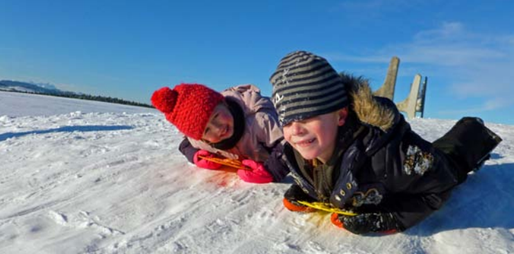
Ob Winter, Frühling, Sommer oder Herbst, die Celenus Fachklinik Bromerhof im Allgäu bietet zu jeder Jahreszeit einen erholsamen und erfolgreichen Aufenthalt