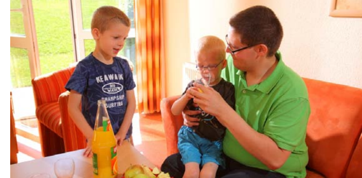
Auch Väter sind bei uns jederzeit willkommen! Ob als Besucher oder gerne auch zu einer Vater-Kind-Maßnahme bzw. einer Familienkur