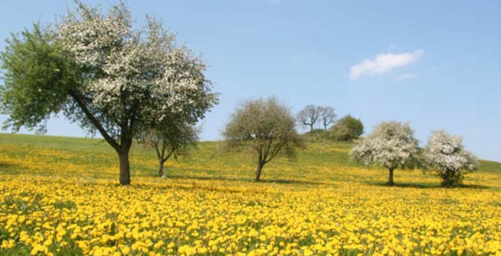
Die Landschaft rund um die Celenus Fachklinik Bromerhof